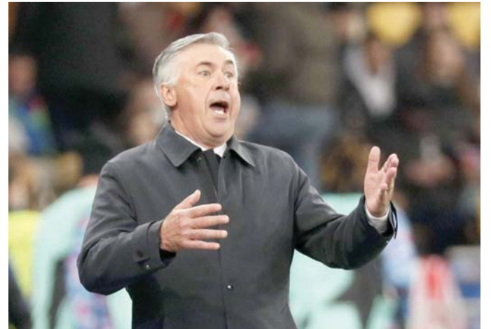
المهمة صعبة لكن ليست مستحيلة

وأردف "كنا في أفضل حالاتنا ضد شاختر دونيتسك، حيث عملنا بشكل جيد، وعلينا مواصلة السير في هذا